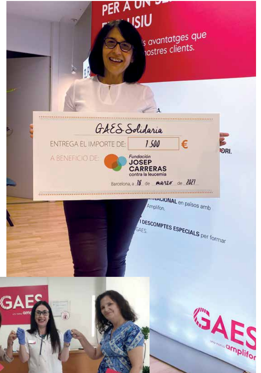
Entrega de la donación a la Fundación Josep Carreras