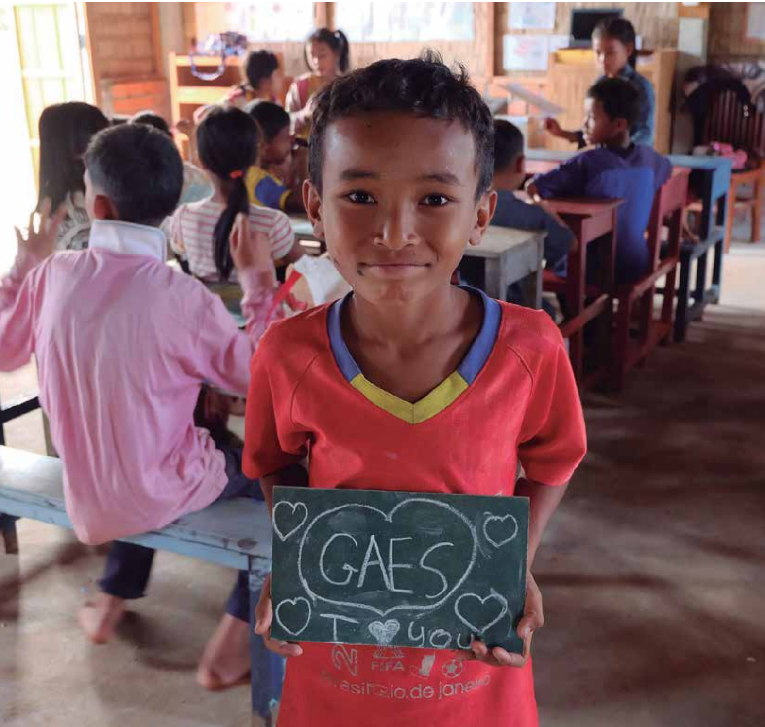
Uno de los niños de la escuela Camboya Sonríe. Proyecto Teaming