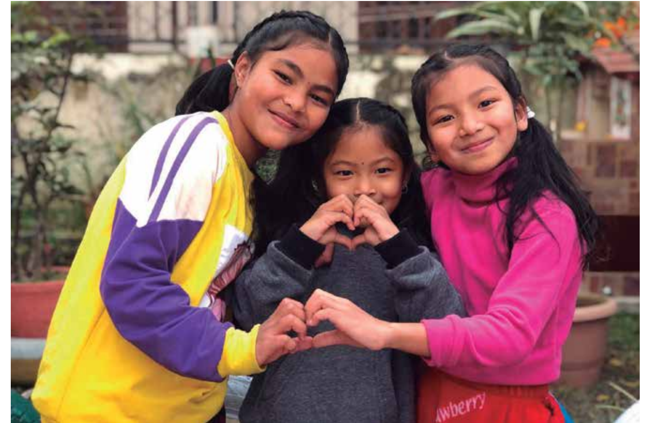
Niñas de la ONG Dream Nepal

se desarrolla junto con el Hospital Sant Joan de Déu, la Federación de Asociaciones Catalanas de Padres y Personas Sordas (ACAPPS) y la Fundación GAES Solidaria. El 1 de febrero de 2020 la Orquesta Simfònica del Vallès estrenó una obra compuesta por la JOGC, fruto de los talleres de composición que realizaron los jóvenes músicos.