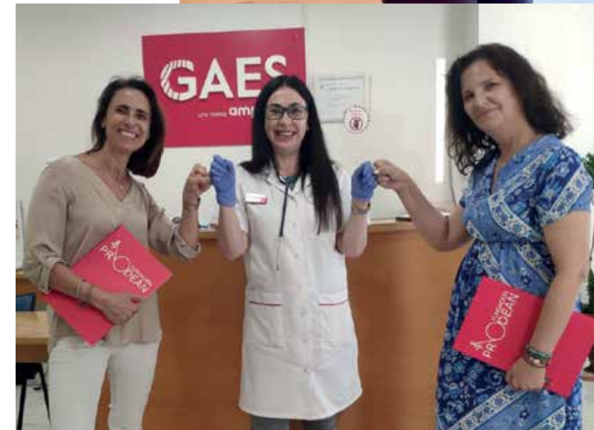
Entrega de la donación a la Fundación Prodean Mérida