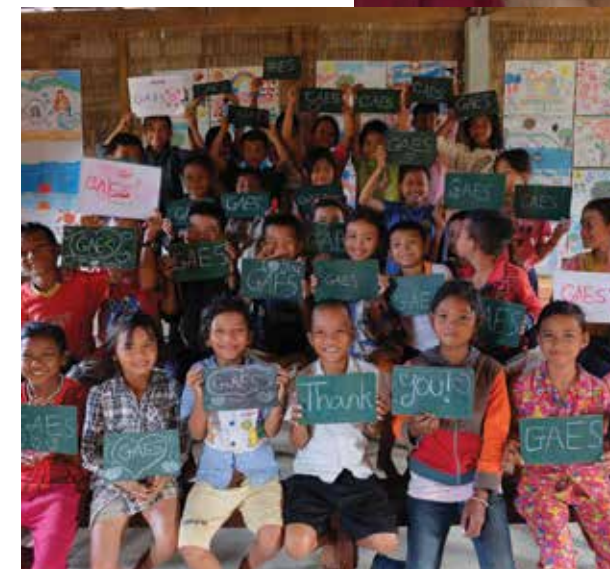
Los niños de la escuela Camboya Sonríe. Proyecto Teaming