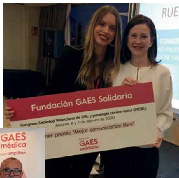
Entrega del primer premio "Mejor comunicación libre" Fundación GAES Solidaria en el congreso Sociedad Valenciana de ORL

En el año 2020 la Fundación GAES Solidaria otorgó 1.600 euros repartidos en 2 premios.