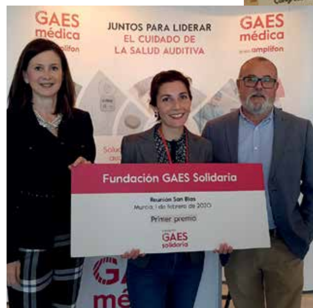
Entrega primer premio Fundación GAES Solidaria en la Reunión de San Blas